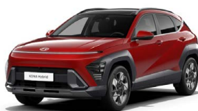
Ultimate Red Metallic Metalická Kombinace dostupná také s černým lakováním střechy Cena: 17 900 Kč