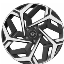
Unikátní N Line 18" kola z lehké slitiny