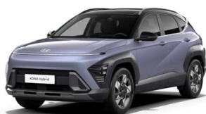
Meta Blue Pearl Perleťová Kombinace dostupná také s černým lakováním střechy Cena: 17 900 Kč