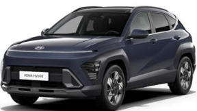
Denim Blue Pearl Perleťová Kombinace dostupná také s černým lakováním střechy Cena: 17 900 Kč