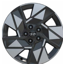
18" kola z lehké slitiny