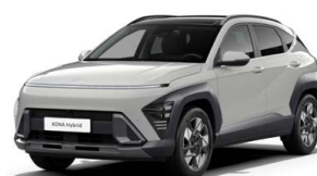
Cyber Gray Metallic Metalická Kombinace dostupná také s černým lakováním střechy Cena: 17 900 Kč