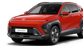
Soultronic Orange Pearl Perleťová Kombinace dostupná také s černým lakováním střechy Cena: 17 900 Kč