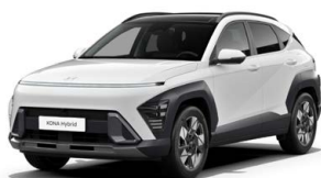
Atlas White Pastelová Kombinace dostupná také s černým lakováním střechy Cena: 9 900 Kč