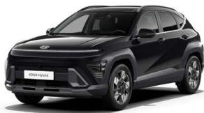
Abyss Black Pearl Perleťová Cena: 17 900 Kč