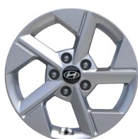
16" kola z lehké slitiny