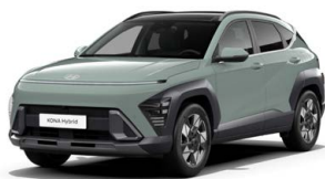
Mirage Green Pastelová Kombinace dostupná také s černým lakováním střechy Cena: 0 Kč