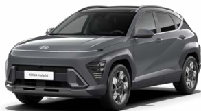
Ecotronic Gray Pearl Perleťová Kombinace dostupná také s černým lakováním střechy Cena: 17 900 Kč